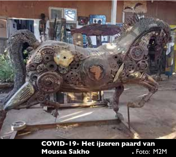
COVID-19- Het ijzeren paard van Moussa Sakho .

Vluchtkerk, in de Wereldtuin en aan de Notweg. Teken en hoop, op wortel schieten.