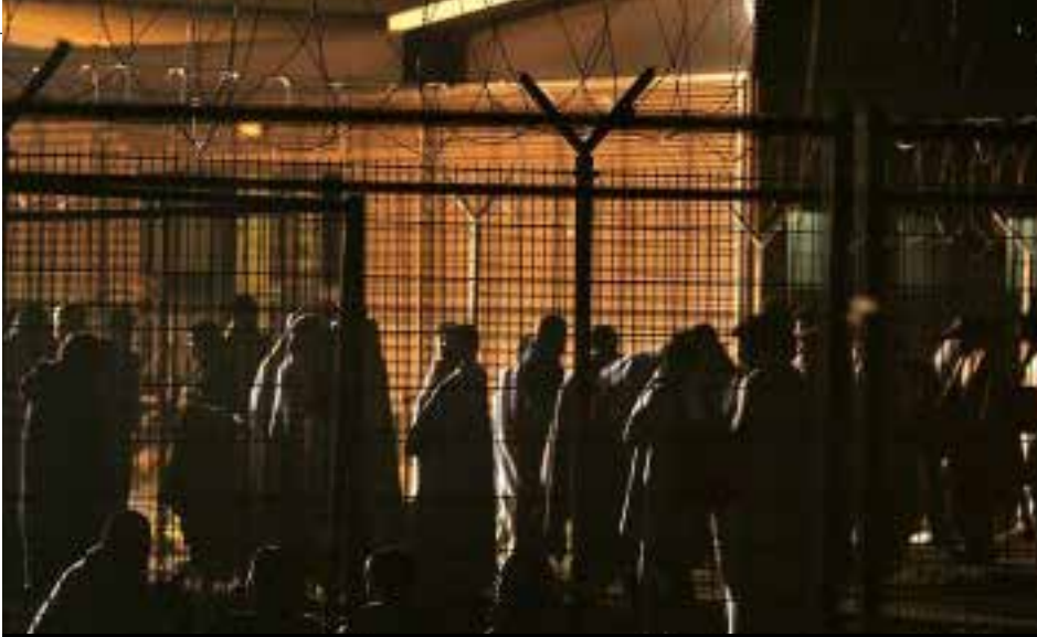
De luchtkooi van Blok K en J tijdens de Schipholbrand.