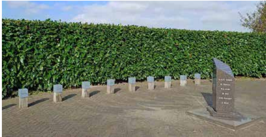
Monument Schipholbrand op Schiphol Oost