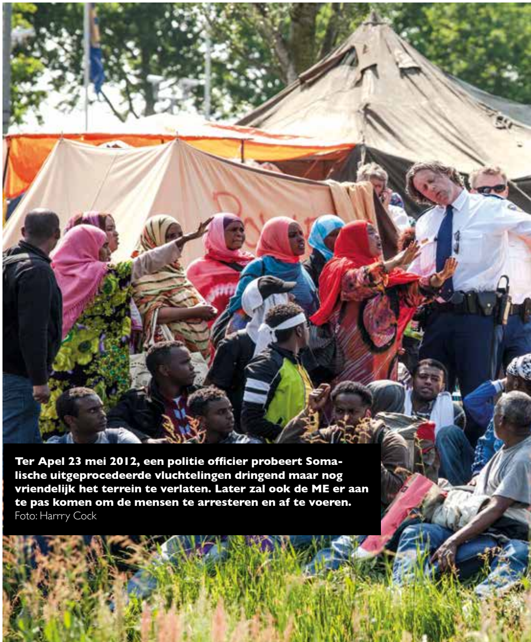
Ter Apel 23 mei 2012, een politie officier probeert Somaalische uitgeprocedeerde vluchtelingen dringend maar nog vriendelijk het terrein te verlaten. Later zal ook de ME er aan te pas komen om de mensen te arresteren en af te voeren.