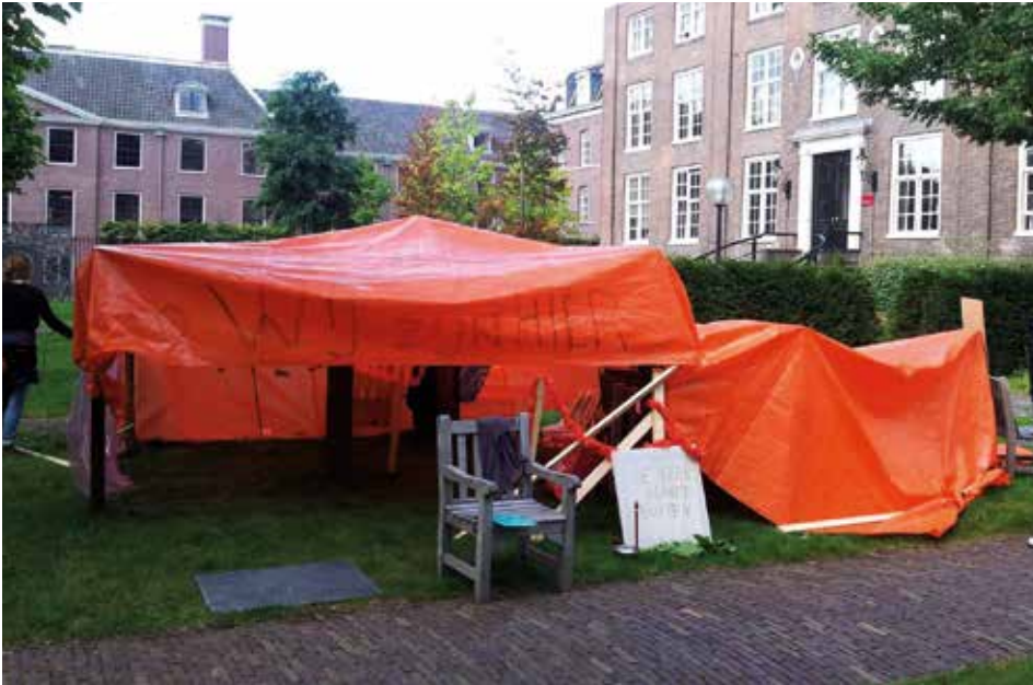
In de Wereldtuin begon dokter Co van Melle op 4 september 2012 met een actie voor bed-bad-brood voor illegaal verklaarde migranten. Het werd de geboorte van We Are Here.

grijpen, en wie weet te verbeteren. Zoals Oumar Berete, een van de leidende Francophone Afrikanen, het uitlegde aan studenten: „Mensen worden geboren met benen. Waarvoor? Om te lopen. En dat begon in Afrika.” Voor zichzelf vroegen de leden van We Are Here niets meer of minder dan „normal life”, de kans om te leven als anderen. Verlangen naar gewoon leven mag nogal banaal klinken, maar is voor een „illegaal” behoorlijk radicaal. Leven zoals