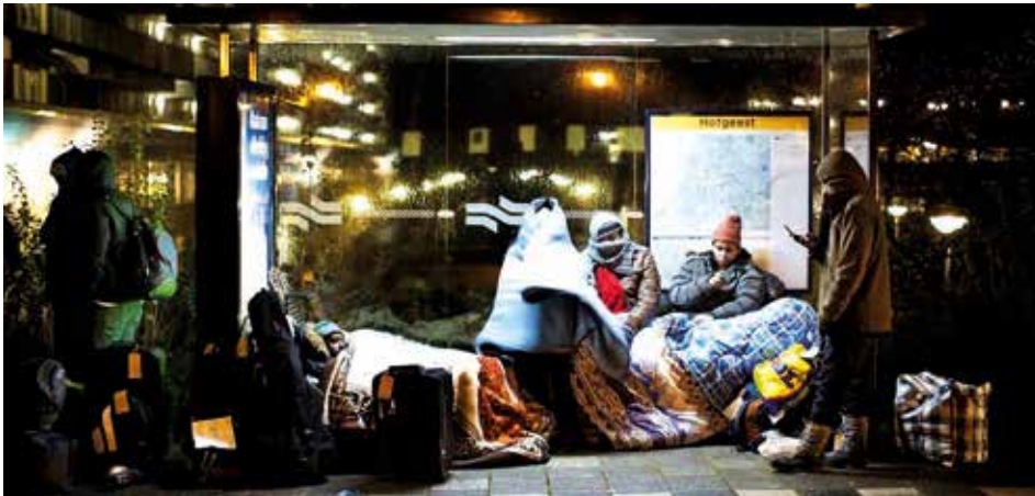
Bushalte Hofgeest, waar leden van We Are Here zich verzamelden in de nacht van 30 november 2012, nadat ze werden vrijgelaten uit politiebureau Flierbosdreef, waar ze waren geparkeerd na de ontruiming van hun tentenkamp in Osdorp.

In de loop van het jaar 2025 ontwikkelde de baobab zich tot voertuig van verbeelding en pièce de résistance van de manifestatie NIET VERGETEN, precies twintig jaar na de Schipholbrand. Na aankomst in Amsterdam bracht Momar zijn eerste bezoek aan de oude drukker en fijnmechanicus John